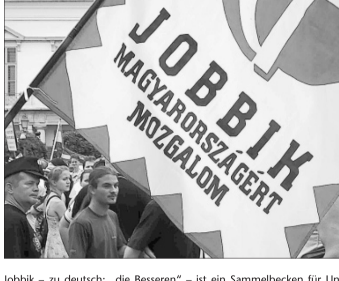
Jobbik – zu deutsch: „die Besseren“ – ist ein Sammelbecken für Ungarns Rechtsextreme.

Doch ungarische Juden und andere Minderheiten sind alarmiert. Denn „Jobbik“ hetzt gegen