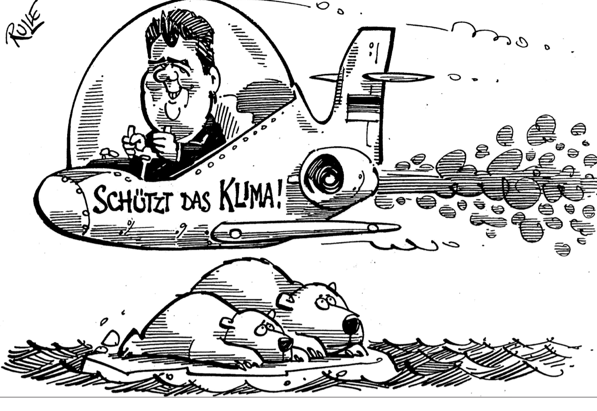
Umwelt-Botschafter im Dauereinsatz

Der „Tages Anzeiger“ (Genf) über Schäubles Anti-Terror-Plan: Wolfgang Schäuble ist schon zu lange im Geschäft, als dass irgendwer wirklich glaubt, er könnte versehentlich seine Pläne für eine eher plumpe Spionagesoftware bekannt gegeben und anschließend die Umsetzung zusätzlich durch unbedachte Äußerungen untergraben haben. (...) Man wird den Eindruck nicht los, dass es dem Innenminister nur darum geht, Gelegenheiten zu schaffen, um die trotzigen Sozialdemokraten als naive Handlanger von Cyber-Kriminellen und Terroristen hinzustellen.