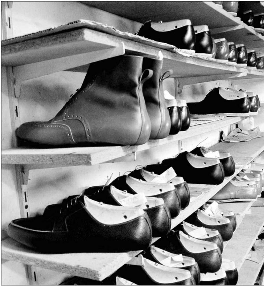
Ein Regal mit kostbarem Inhalt – Schuhe in der Werkstatt von Lászlo Vass.